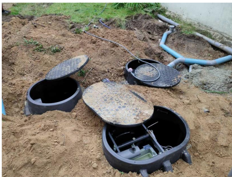
Figure 2 : Filtre compacte ECOFLO 6 EH

L'ensemble des contrôles décrits précédemment fait l'objet d'un rapport envoyé à l'utilisateur du service.