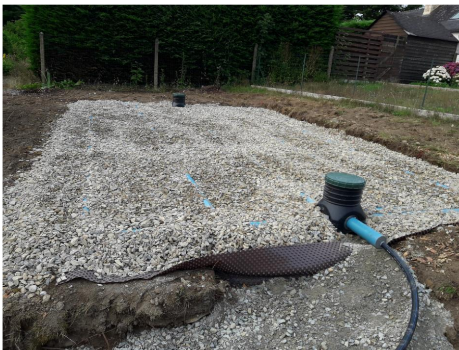
Figure 2 : Filtre à sable vertical non drainé 40 m 2

L'ensemble des contrôles décrits précédemment fait l'objet d'un rapport envoyé à l'utilisateur du service.