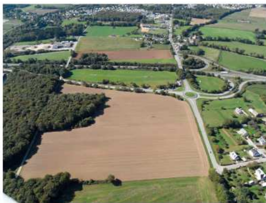
Secteur prévu pour l'extension de la zone d'activités du Porzo.