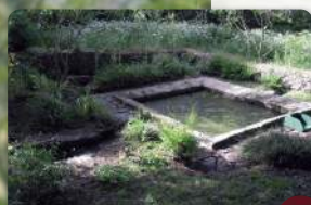
Fontaine et lavoir de St-Sterlin