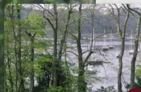
Vue de la Ferme du Bonhomme

Départ du parking du Pont du Bonhomme , côté Kervignac (aire de pique-nique) 1 et 2 .