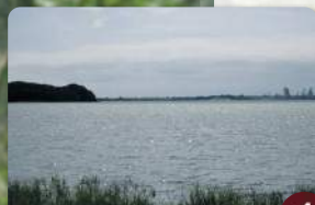
Vue du lieu-dit La Fabrique