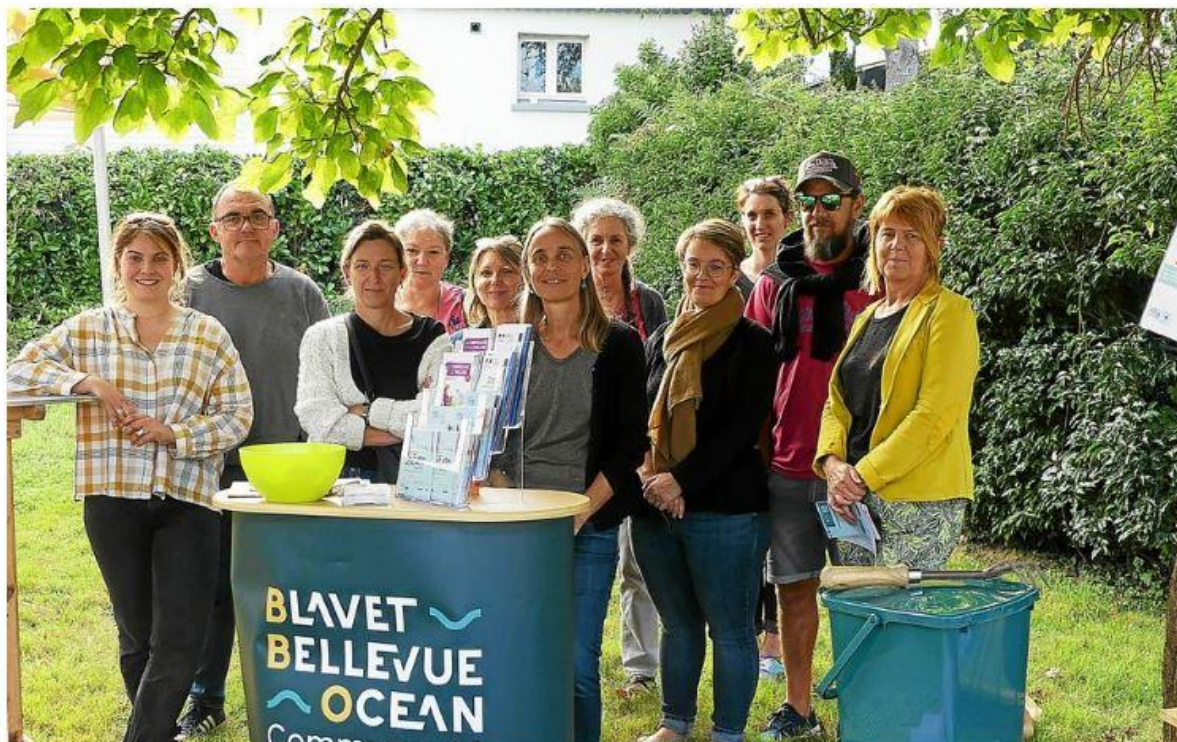
La résidence du Verger a été choisie comme site pilote pour les pavillons de compostage partagé.

Blavet Bellevue Océan (BBO) communauté a organisé, vendredi 29 septembre, un apéro compost à Nostang pour présenter le projet des composteurs collectifs.